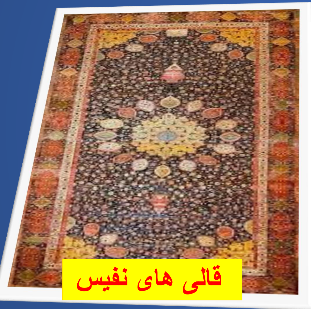
قالی های نفیس