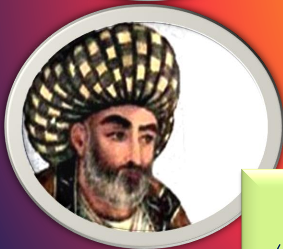
علامه محمد باقر مجلسی