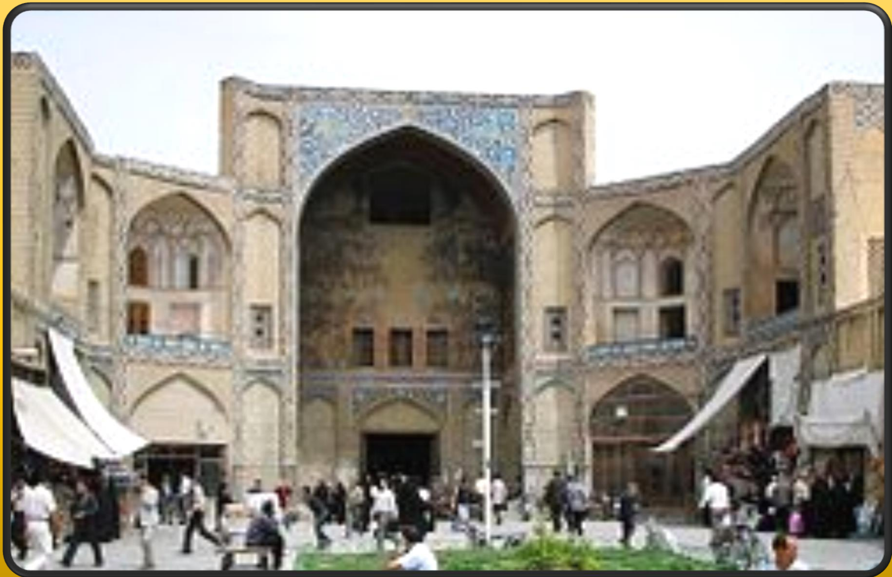
نقاره خانه و سردر قیصریه