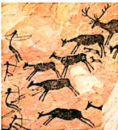
تصویر نقاشی از داخل غار لاسکو در فرانسه، غذای معتقدند که این نقاشی‌ها مربوط به ۱۳۰۰۰ سال پیش است.

۴ (نقاشی‌های به جا مانده روی دیوار غارهای قدیمی یا تخته سنگ‌ها نشان می‌دهد که شکار در تأمین غذای انسان‌ها در آن دوره نقش مهمی داشته است.)