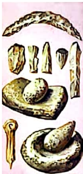
ابزارهای سنگی اولیه برای کشاورزی و آرد کردن گندم و جو

۱- انسان‌ها چگونه یاد گرفتند کشاورزی کنندم