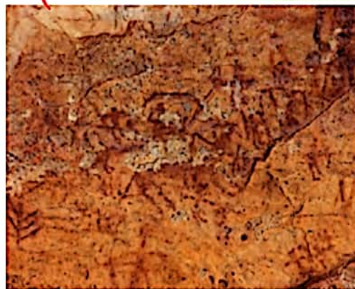
تصویر نقاشی بر روی صخره، میرلاس، کوه‌دشت استان لرستان، ایرانی