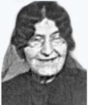
بی بی مریم بختیاری

دختر حسینقلی خان ایلخانی در سال ۱۲۵۳ در منطقه بختیاری زاده شد. او از زنان باسواد و روشنفکر عصر خود بود، که همزمان با وقوع انقلاب مشروطه، به طرفداری از حقوق زنان برخاست. وی فنون اردو کشی نظامی و لشکر داری را از پدر و برادرانش آموخت و آموزه‌ها را در زمان نبردهای انقلاب مشروطه؛ در فتح تهران و نیز فتح اصفهان، همچنین در جنگ جهانی اول به کار بست. وی از سرمایه مادی و معنوی خانواده خود برای تشکیل یک هنگ از سواران بختیاری، برای مبارزه با اشغال گران روس و انگلیس، در جنگ جهانی اول استفاده کرد.