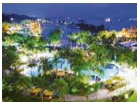
جزیره سنتوزا در نزدیکی سنگاپور