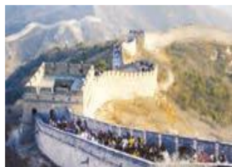
دیوار بزرگ چین