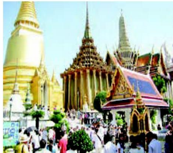
معبد بوداییان در تایلند که گردشگران از آن بازدید می کنند.

آیین های دیگر که در آسیا پیروان زیادی دارند : ۱- آیین بودا که خاستگاه اصلی آن، شمال هند است و در کشورهای شرق آسیا چون چین، ژاپن، کره و تایلند نیز انتشار یافته است. ۲- آیین برهمنی در شبه جزیره هند. [البته بیش از ۱۰ درصد جمعیت ۱/۳ میلیارد نفری هند، مسلمان هستند.] ۳- آیین دائو و کنفوسیوس، در چین و کشورهای شرق آسیا این چند آیین، در قاره های دیگر کمتر نفوذ دارند.