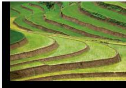
کشت برنج به صورت پلکانی روی تپه