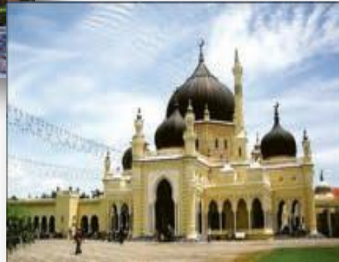
مسجد زاهر مالزی