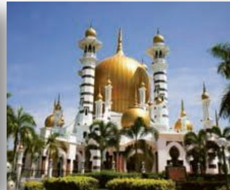
مسجدی در مالزی