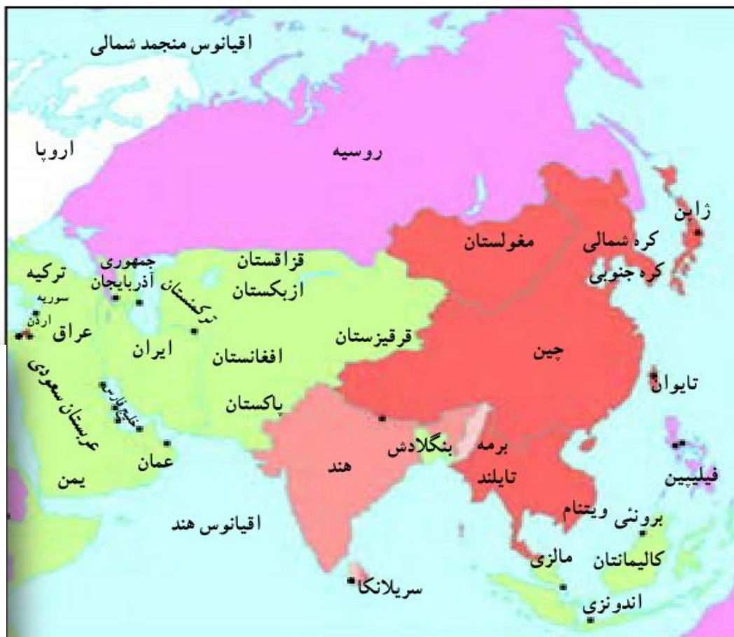
○ نقشه پراکندگی ادیان در قاره آسیا

گرچه محل بعثت پیامبر اسلام و نقطه شروع دین اسلام، مکه بوده است ولی دین اسلام در همه کشورهای :