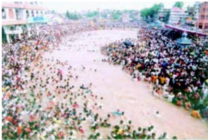
هندوها رود گنگ را مقدس می شمارند و معتقدند در این رود، گناهاشان پاک و شسته می شود. هر ساله میلیون ها نفر هندی برای شست و شو در رود گنگ به این منطقه می آیند.