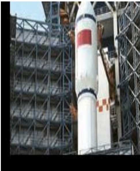
طراحی ، ساخت و پرتاب ماهواره در چین