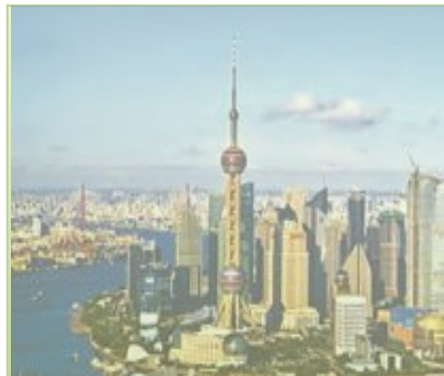
بندر شانگهای چین با بیش از ۲۳ میلیون نفر جمعیت