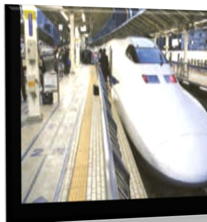
یک قطار پیشرفته در ژاپن

ژاپن و روسیه عضو کشورهای گروه هشت هستند.