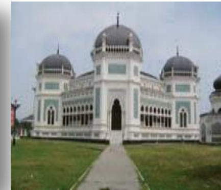
مسجدی در اندونزی