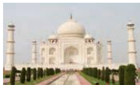
تاج محل در هند