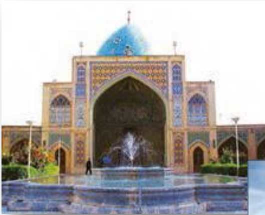
مسجد جامع زنجان ، ایران

به دلیل گسترش دین اسلام در بیشتر نقاط کره زمین می توان چشم اندازها و مناظری را که نشان دهنده فرهنگ و تمدن اسلامی است مشاهده کرد. در آسیا مساجد باشکوهی که از شاهکارهای معماری اسلامی است، ساخته شده است.