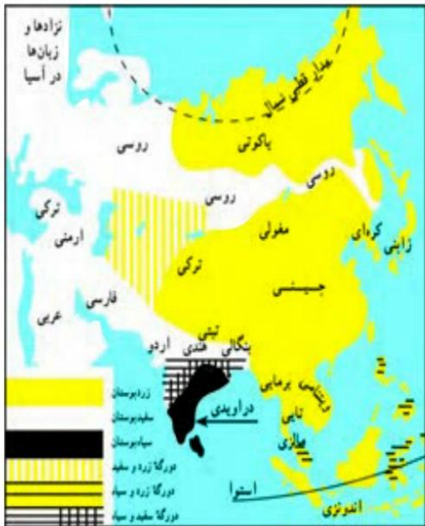
○ نقشه پراکندگی نژادها و زبانها در آسیا

مردم آسیا به صدها زبان و لهجه حرف می زنند. مانند: چینی، ترکی، عربی،