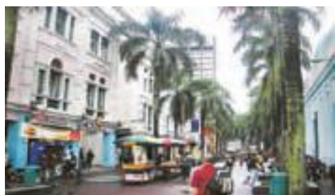
خیابانی در کوالالامپور، مالزی

از سراسر دنیا، درآمد خوبی به دست می آورند.