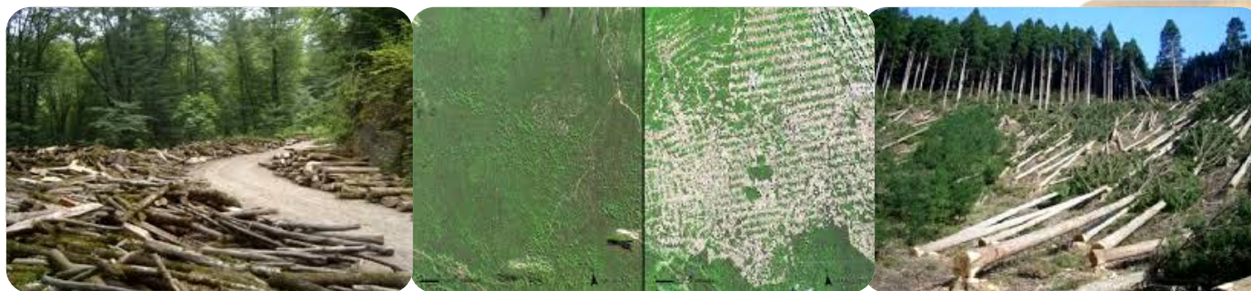
صفوی فارس، جهرم