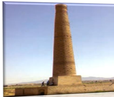
میل خسرو گرد در نزدیکی سبزوار

در قرن ۵ تا ۷ هجری قمری ، « آجرکاری و کاشی کاری » در بناها به اوج زیبایی و شکوفایی رسید