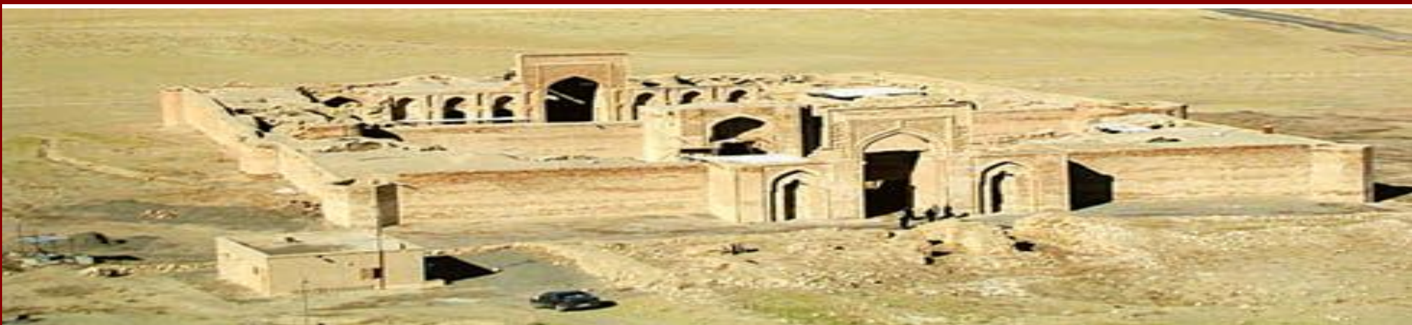
کاروانسرای شرف در نزدیکی سرخس (استان خراسان رضوی)