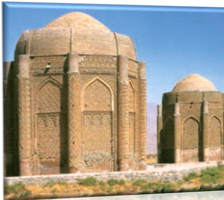
برج های خرقان در شهرستان آوج

معماران در دوره سلجوقی بناهای زیبایی در ایران ساختند و معماری در آن دوران به اوج شکوفایی خود رسید. در ساخت مساجد ایرانی ابتکار خاصی به کار رفت و حیاط و چهار ایوان اطراف آن معمول گردید. در ساختن انواع گنبدها، برج ها، مناره ها، کاروانسراها و مدارس الگوهای جدیدی در معماری به کار گرفته شد..