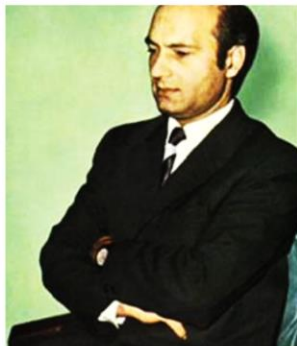
دکتر علی شریعتی