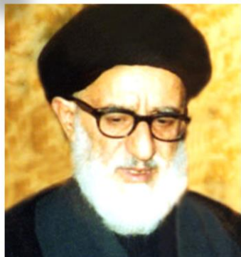
مرحوم آیت الله طالقانی

علاوه بر یاران و پیروان امام خمینی، گروه های دیگری نیز با عقاید سیاسی متفاوت در مبارزه با حکومت پهلوی شرکت داشتند.