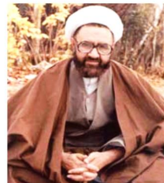
آیت الله مطهری