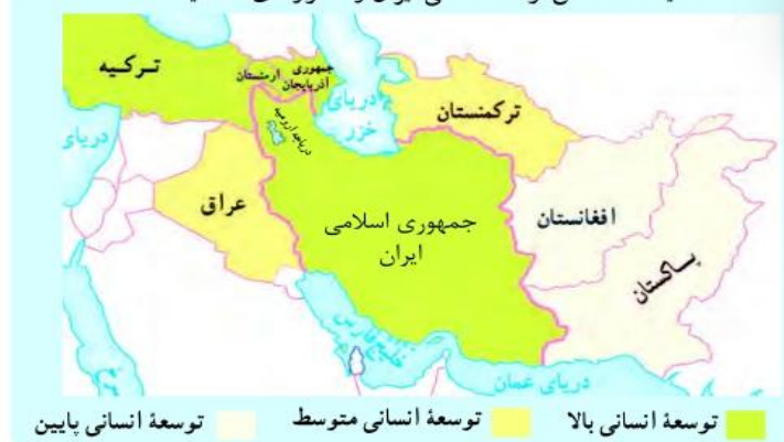
مقایسه شاخص توسعه انسانی ایران و کشورهای همسایه

جایگاه توسعه ایران در بین کشورهای همسایه