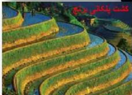
کنت پلنگانی درج