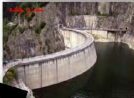
سد و جاده