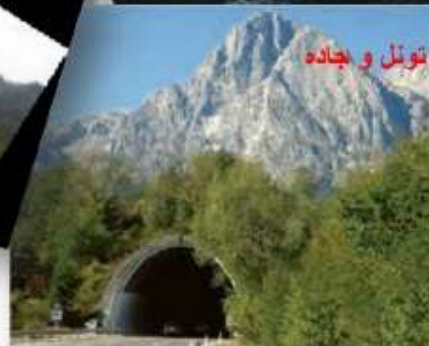
تونل و جاده