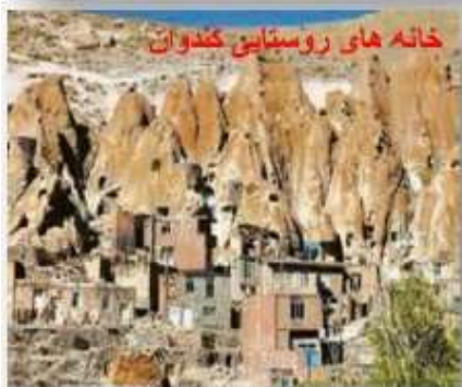
خانه های روستای کندوان