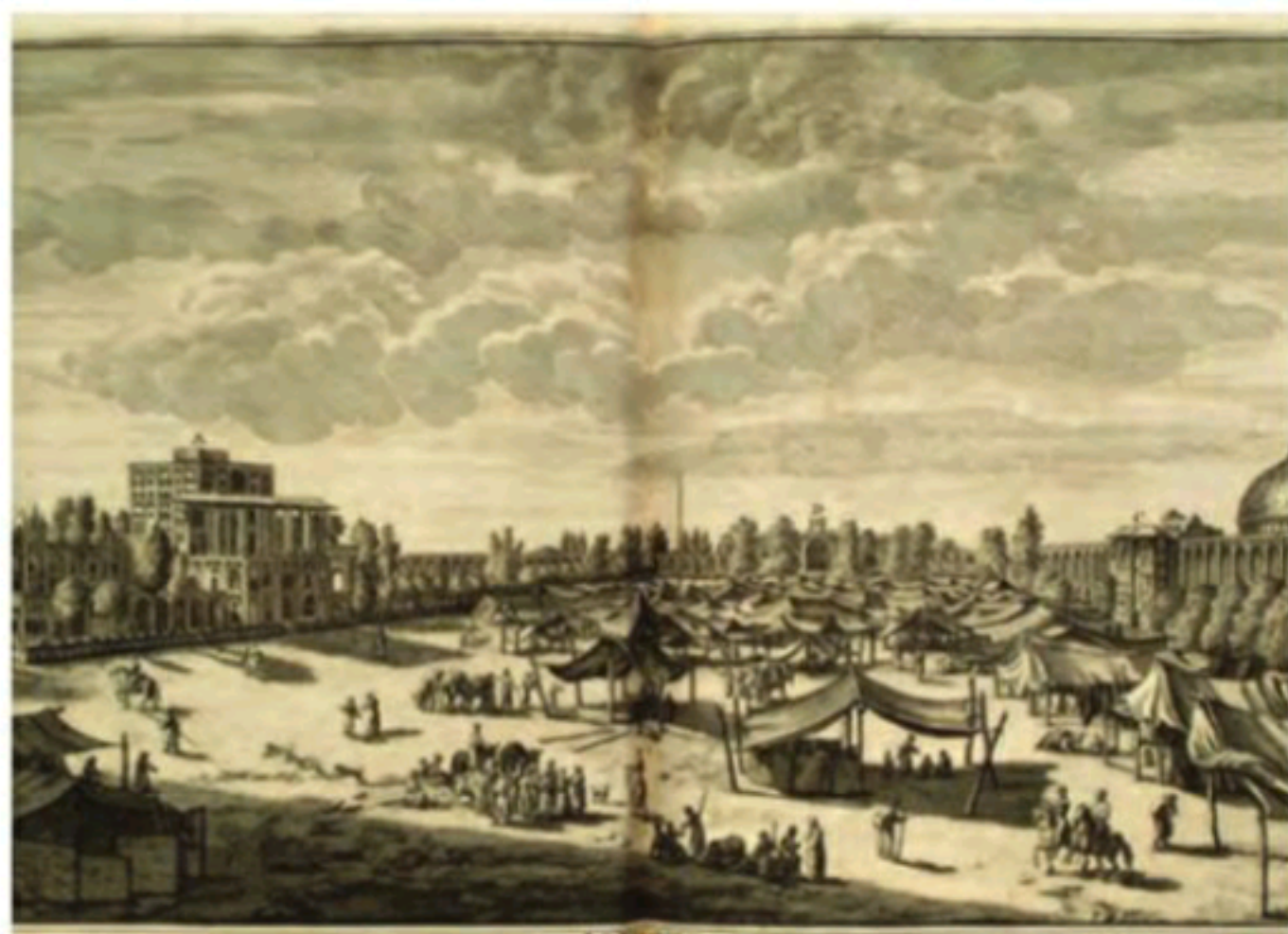
یک نمایی قدیمی از میدان نقش جهان در دوران صفویه که نشانگر رونق تجاری در این دوره است.

در دوران صفویه و با افزایش اقتدار و امنیت در کشور، تولید و تجارت افزایش یافت و ایران با برخی از کشورهای اروپایی روابط سیاسی و بازرگانی برقرار کرد. در آن زمان اروپاییان شرکت‌های بزرگ تجاری تأسیس کرده بودند و می‌خواستند که روابط تجاری خود را با دیگر کشورها مخصوصاً ایران افزایش دهند و در این مسیر به رقابت می‌پرداختند. به همین دلیل، نمایندگانی را برای عقد قراردادهای بازرگانی به کشور ما فرستادند. (۲۲)