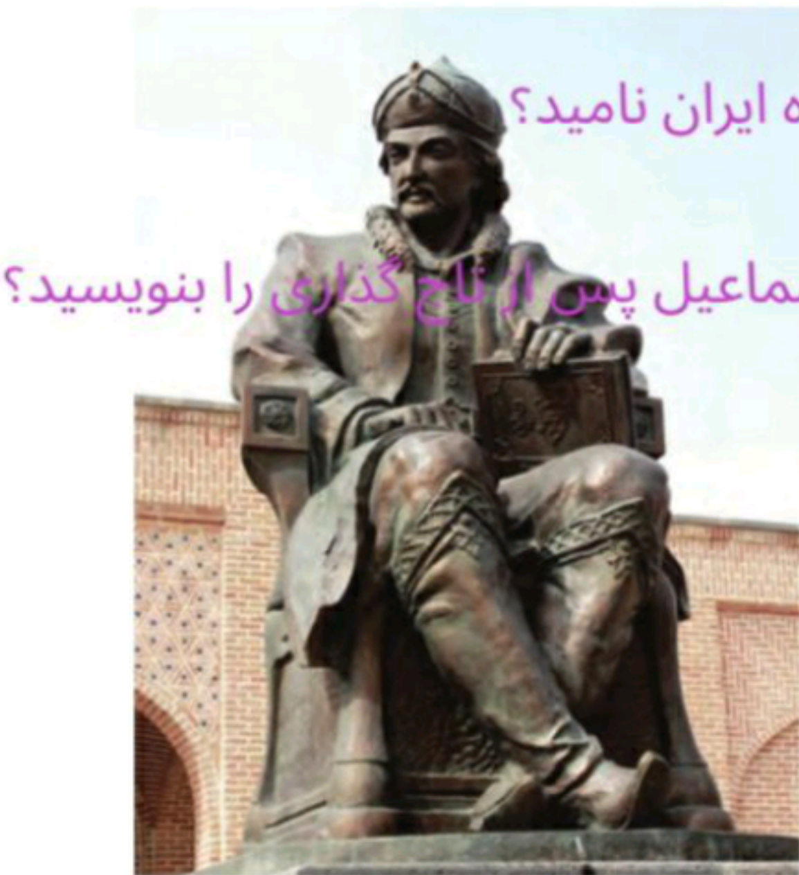
تندیس شاه اسماعیل اول صفوی

در ابتدای قرن ۱۰ ق یکی از نوادگان شیخ صفی به نام اسماعیل به قدرت رسید.