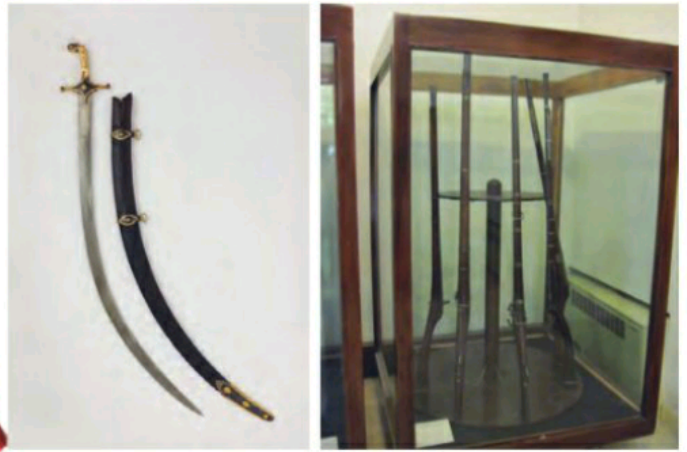
نمونه‌ای از سلاح‌های دوره صفویه