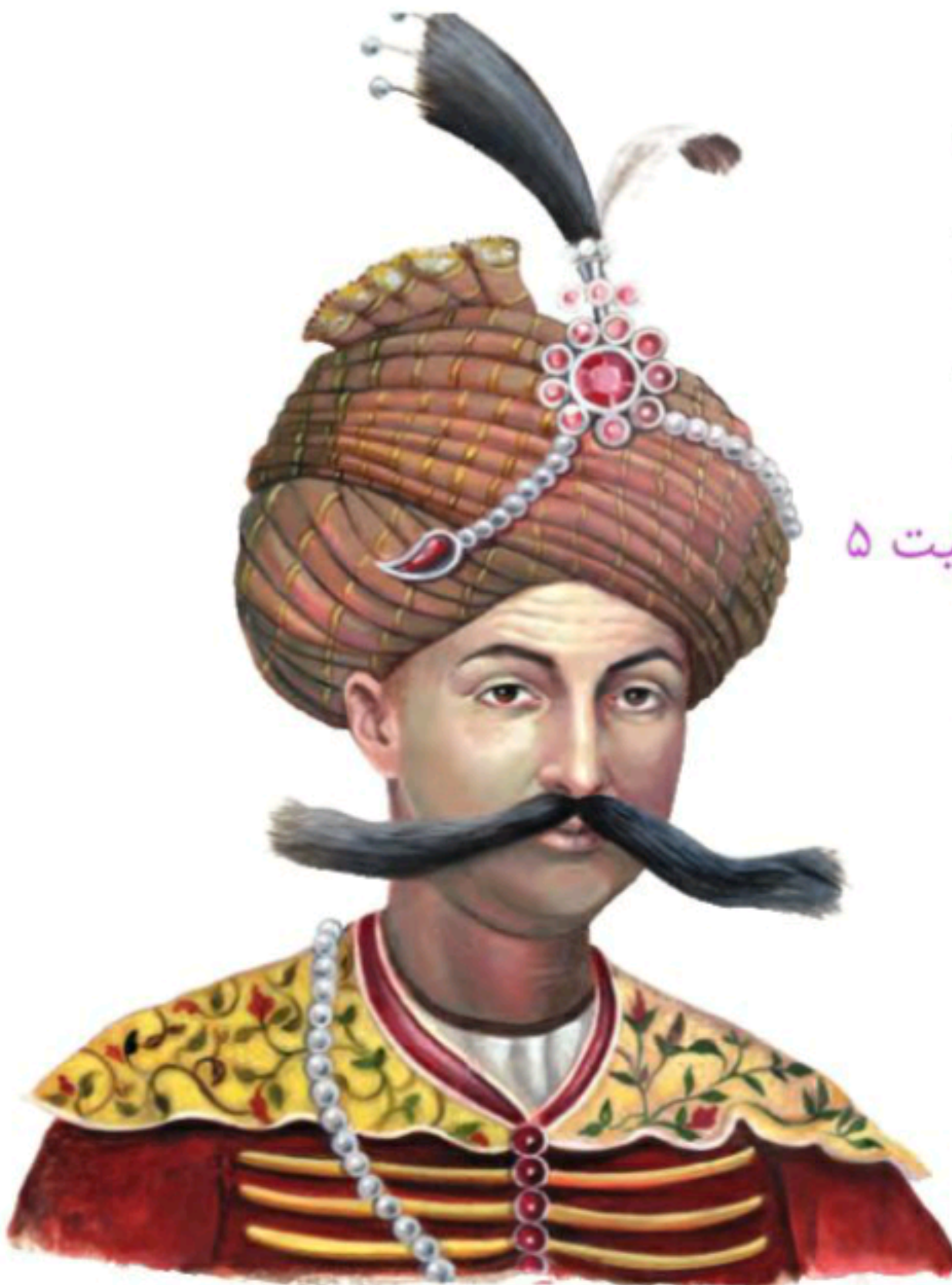
شاه عباس اول صفوی

۵) تا زمان شاه عباس اول، سران ایل قزلباش حاکم ولایت‌های مختلف ایران بودند. شاه عباس اول برای تقویت حکومت مرکزی و جلوگیری از نافرمانی و بی‌نظمی سران ایل قزلباش، حکومت ولایت‌ها را از آنان گرفت و به افرادی غیر از قزلباش‌ها سپرد. همچنین در کنار سپاه قزلباش، سپاه جدیدی از افراد غیر قزلباش تشکیل داد و با کمک گرفتن از اروپاییان، این سپاه را به تفنگ و توپ مجهز کرد. (جواب فعالیت ۵)