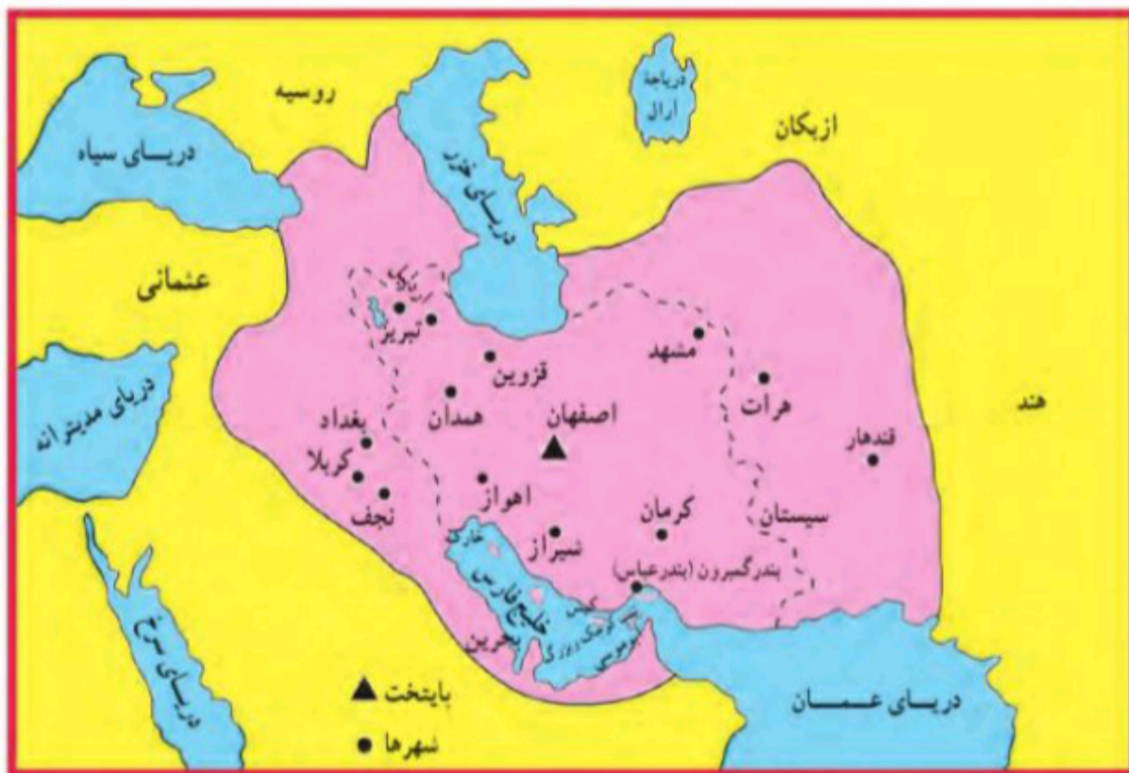
ایران در زمان صفویان (شاه عباس)

منتقل کرد و برای آبادانی آن بسیار کوشید.) (۱۳) ۱۳- اقدامات شاه عباس صفوی را بنویسید؟