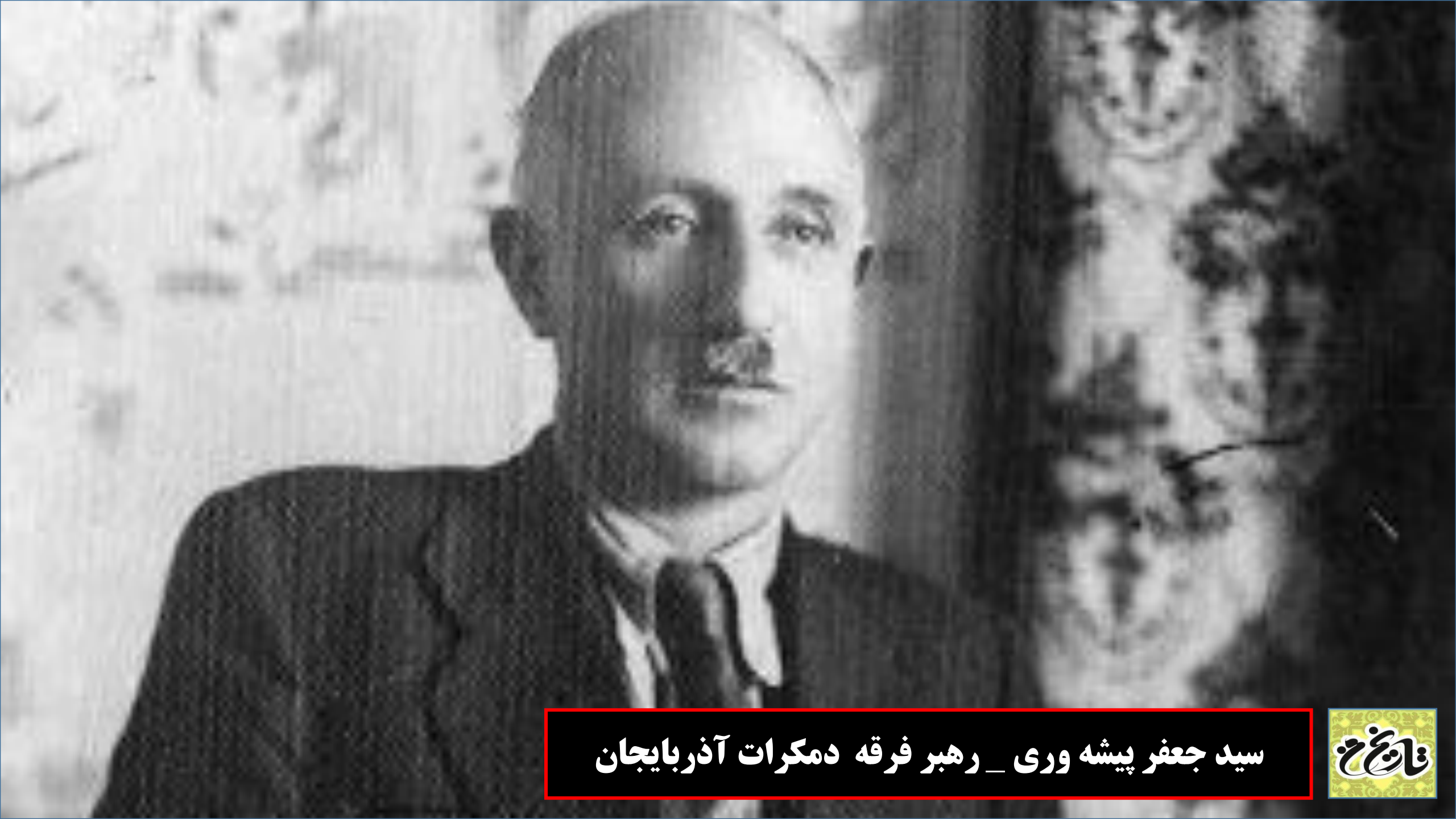
سید جعفر پیشه وری _ رهبر فرقه دمکرات آذربایجان