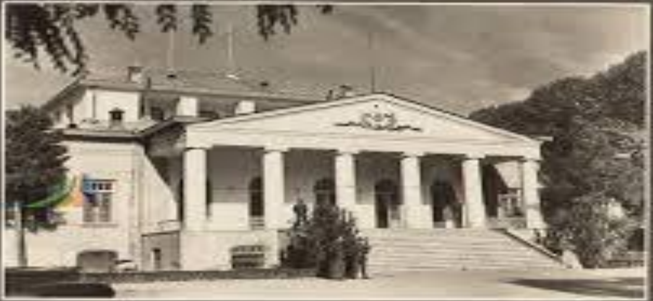
مجلسداری کیرانی شوروی و تهران که مارشال استالین در آن جلسه معذرت و بدت یکین بهترین سحران در آنجا آهست و است...