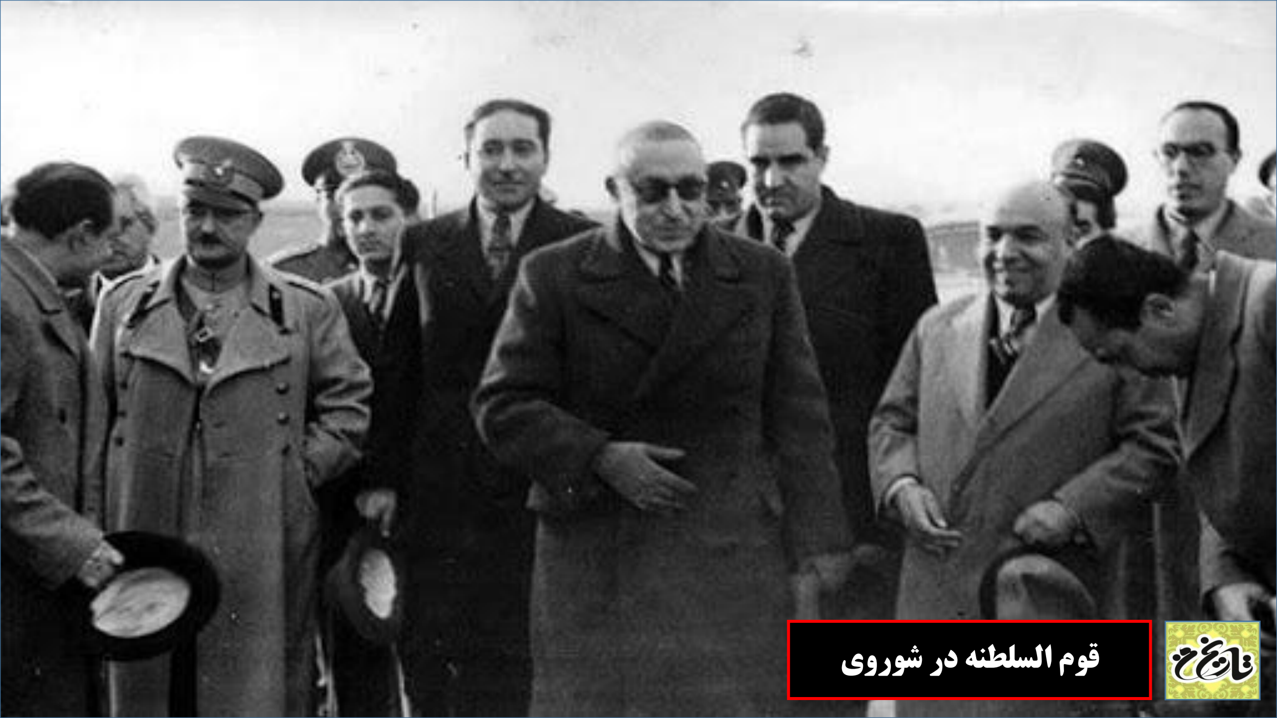
قوم السلطنه در شوروی