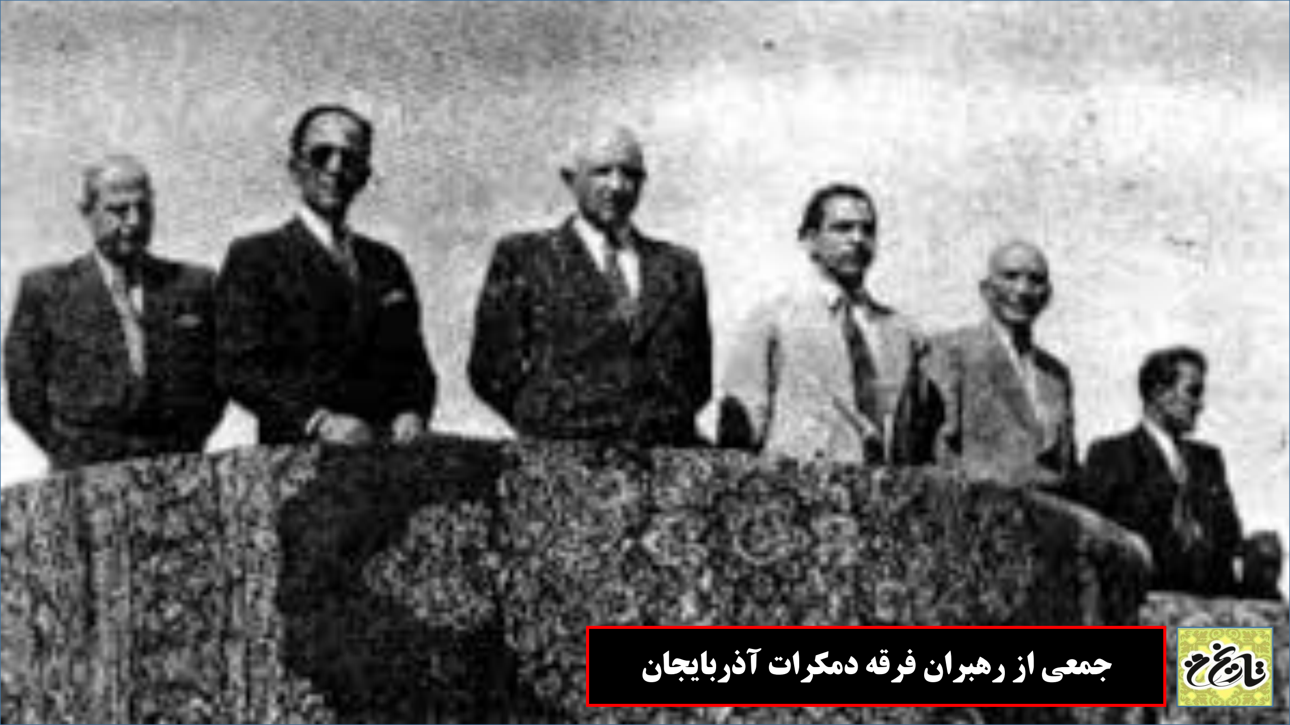
جمعی از رهبران فرقه دمکرات آذربایجان