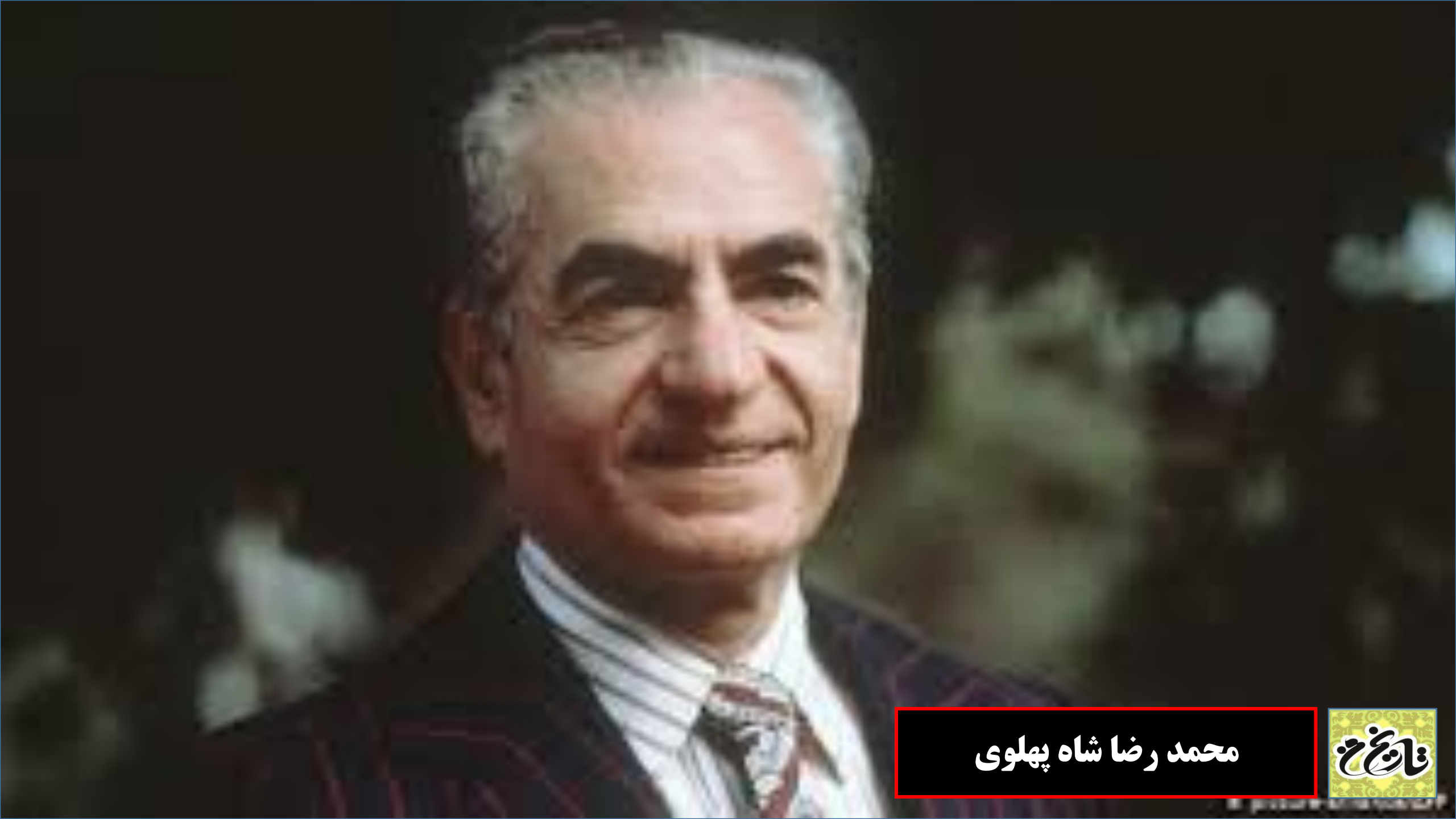
محمد رضا شاه پهلوی