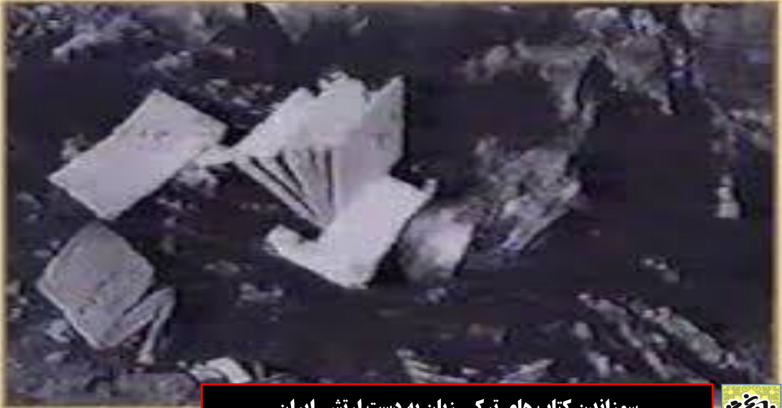
مکتب نوروزی در حین تخریب

سوزاندن کتاب های ترکی زبان به دست ارتش ایران