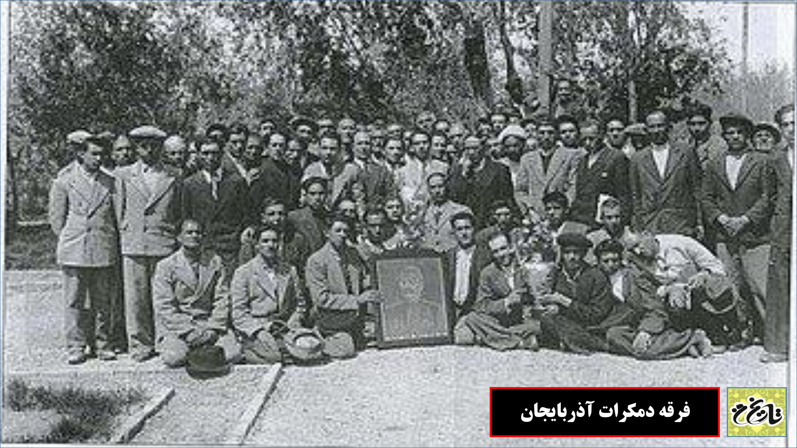
فرقه دمکرات آذربایجان