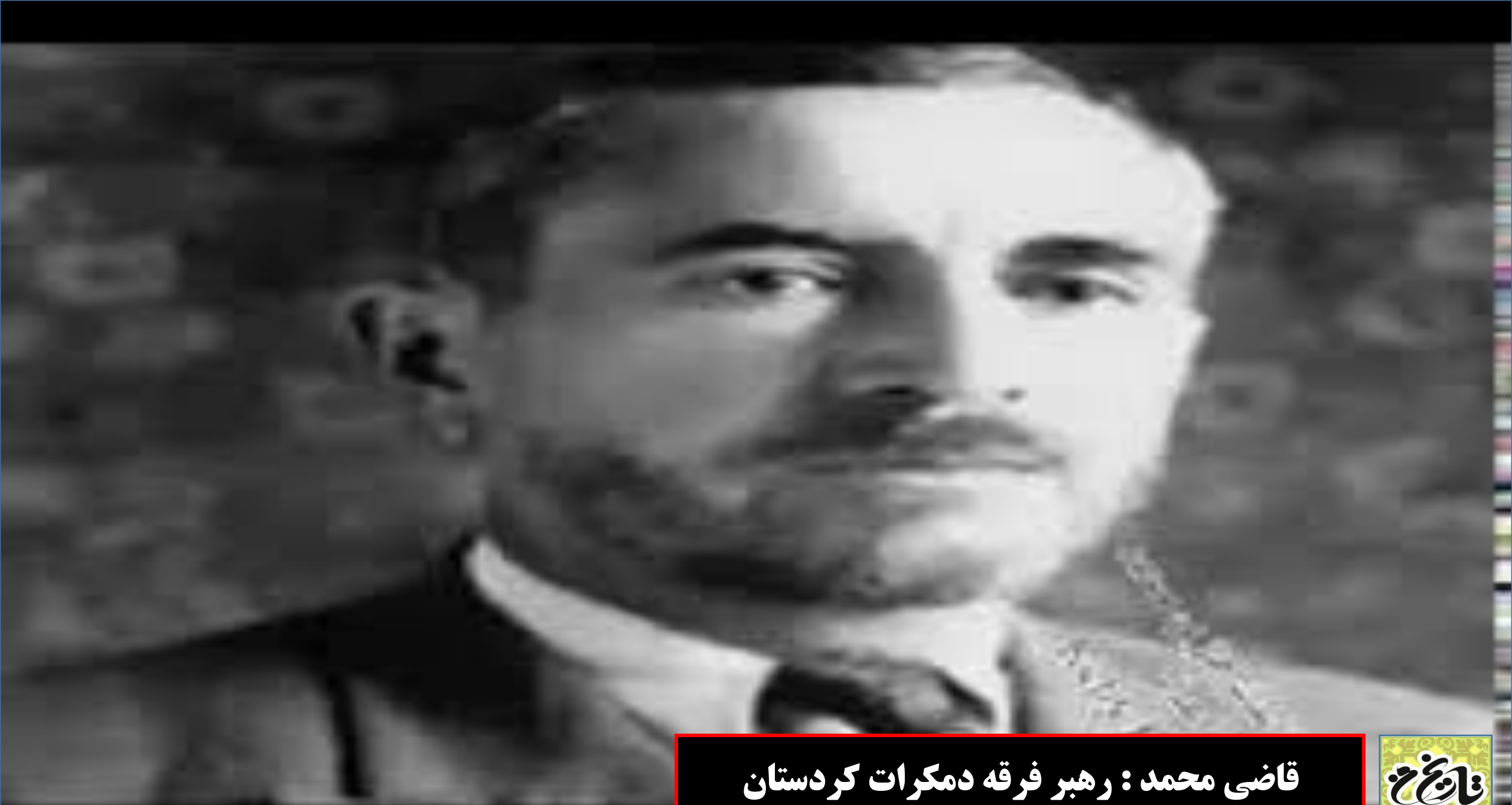
قاضي محمد : رهبر فرقه دمكرات كرستان