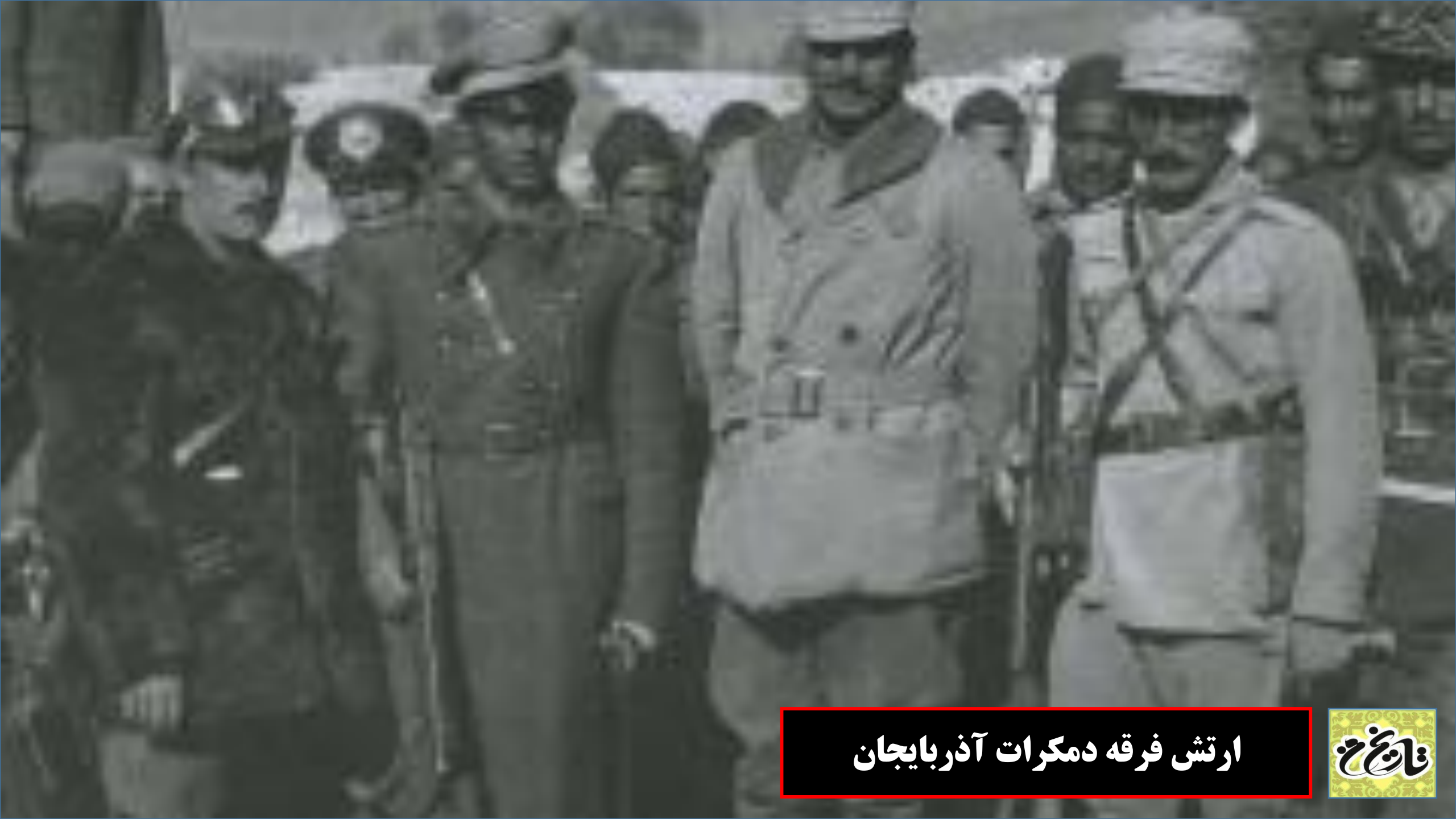
ارتش فرقه دمکرات آذربایجان