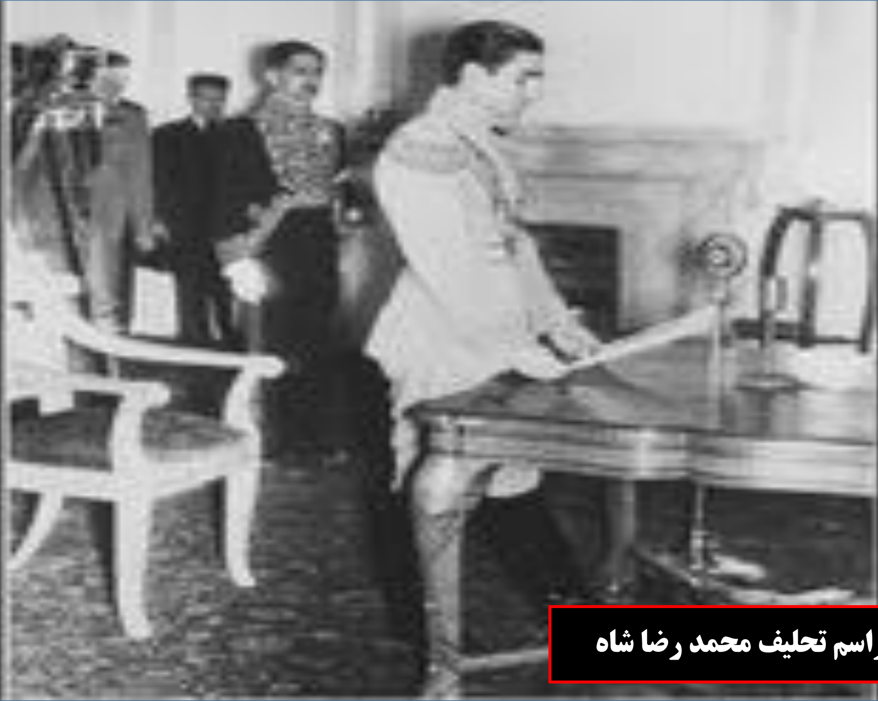
مراسم تحلیف محمد رضا شاه