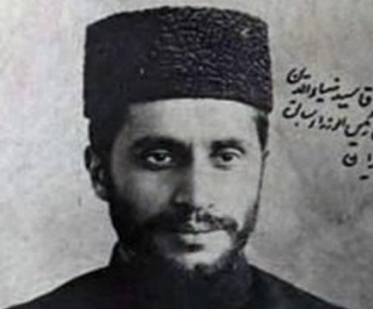
آقای آقا سیدضیاءالدین طباطبایی رئیس انجمن ارباب

انگلستان، سیدضیاءالدین طباطبایی ، عامل سیاسی کودتای سوم اسفند ۱۲۹۹ را، که در فلسطین به کار واسطگی خرید زمین از مسلمانان برای یهودی ها و کمک به اشغال آن اشغال داشت، به ایران بازگرداند. او حزب «اراده ملی» را تشکیل داد.