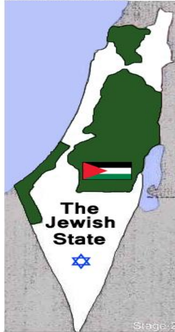
UN Partition plan 1947