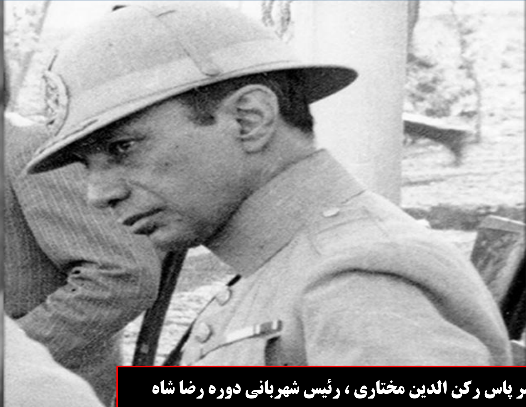
سر پاس رکن الدین مختاری ، رئیس شهربانی دوره رضا شاه