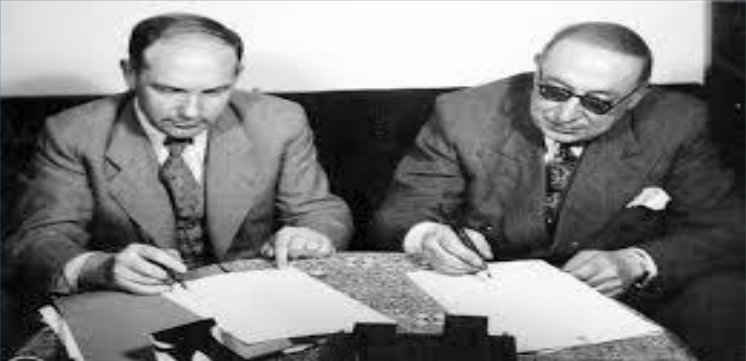
امضای قرارداد واگذاری نفت شمال به شوروی / قوام السلطنه