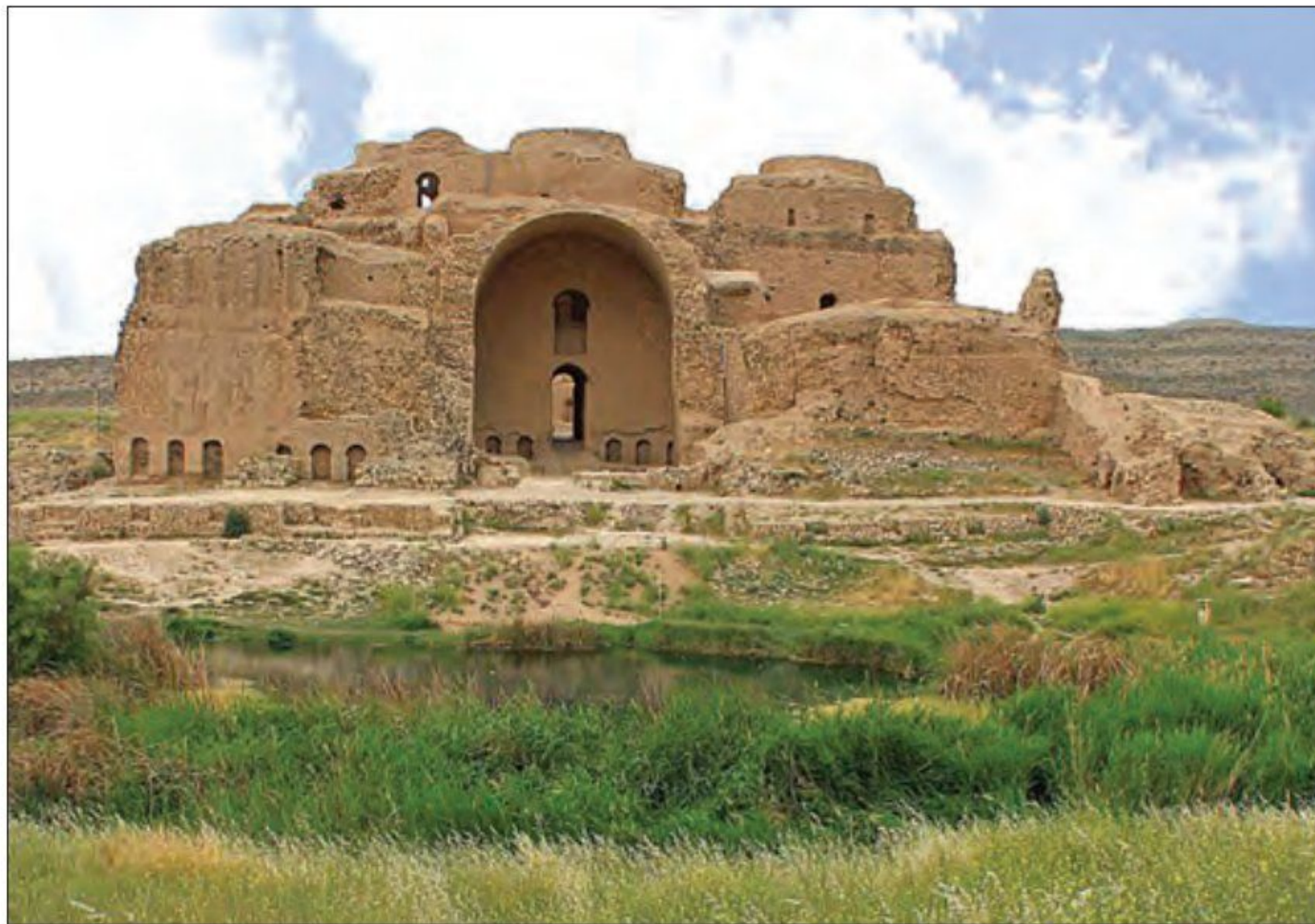
بقایای کاخ اردشیر بابکان - فیروزآباد - استان فارس