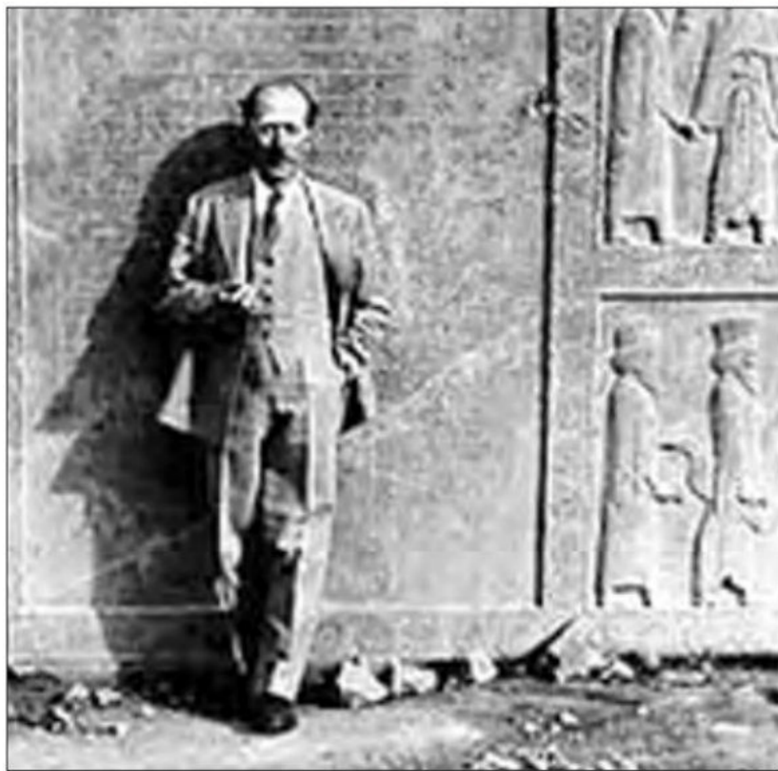
○ ارنست هرتسفلد در تخت جمشید

1) با گسترش روابط سیاسی و اقتصادی ایران و اروپا در دوره قاجاریه، اروپاییان بیشتری به عنوان جهانگرد، بازرگان، سفیر، باستان شناس و ... به کشور ما آمدند و رمز به روز بر تعداد بازدیدکنندگان خارجی از آثار و مکان های تاریخی بخصوص تخت جمشید، پاسارگاد و شوش افزوده شد. بدین گونه، کم کم زمینه برای انجام کاوش های باستان شناسی در ایران فراهم آمد. در زمان محمدشاه قاجار یک افسر انگلیسی به نام سر هنری راولینسون ۱ موفق به خواندن خط میخی شد و سنگ نوشته داریوش هخامنشی در بیستون را ترجمه کرد ۲ (با خوانده شدن خط میخی، علاقه اروپاییان به فعالیت های باستان شناسی در ایران بیشتر شد و دولت فرانسه اجازه حفاری و سپس امتیاز انحصاری کاوش های باستانی را در سرتاسر ایران به دست آورد ۳ ). پس از آن بود که باستان شناسانی از فرانسه به کشور ما آمدند و در محوطه باستانی شوش به حفاری و کاوش مشغول شدند.