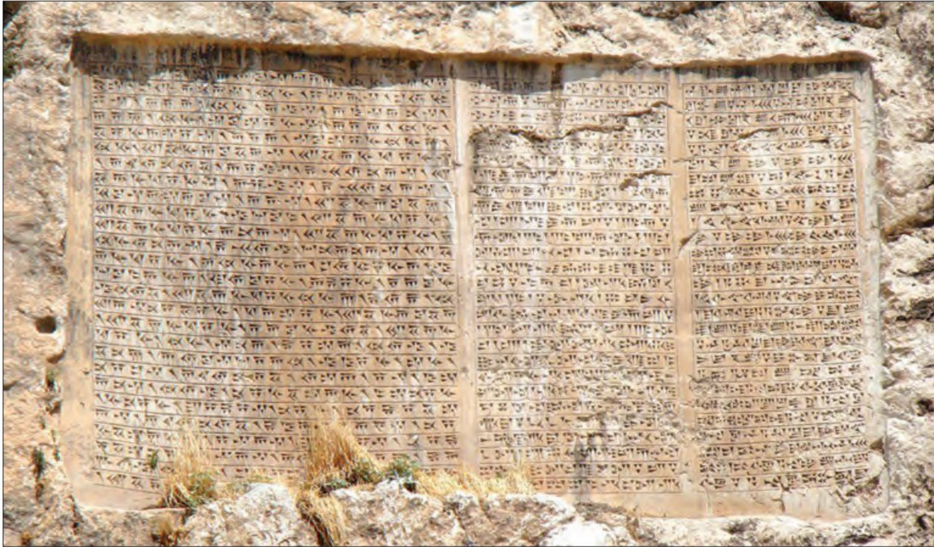
● سنگ نوشته خشایارشا هخامنشی - شهر وان - ترکیه

اقتصادی و اجتماعی و تشکیلات اداری دوره هخامنشیان ارائه می‌دهند. 3