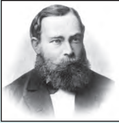
(فرگه ۱۹۲۵-۱۸۴۸ م)

از مهندسی الکترونیک و مهندسی سخت افزار و هوش مصنوعی گردیده‌اند.