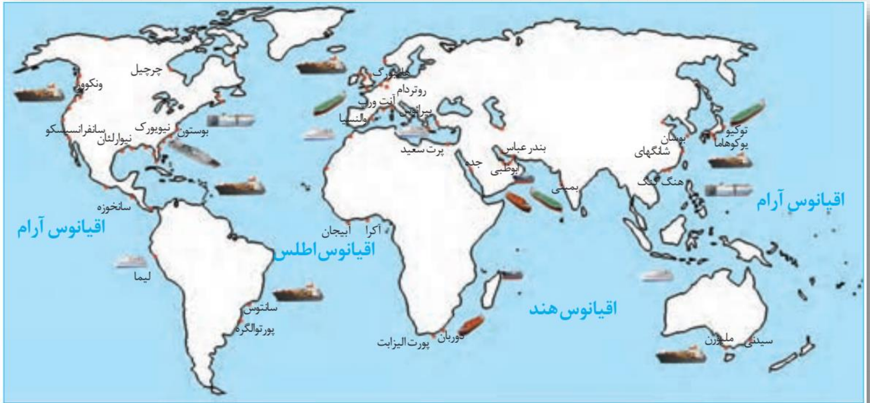
برخی از مهم ترین بنادر جهان