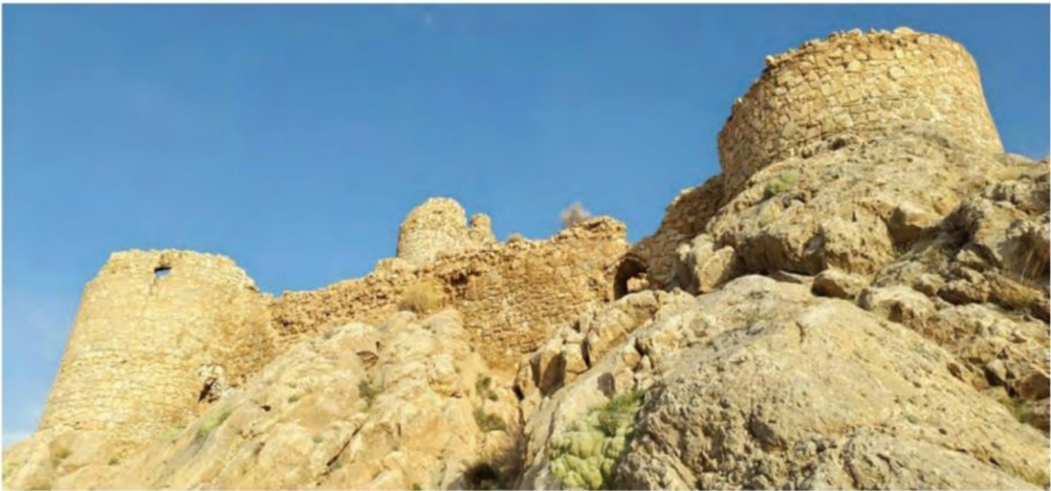
بقایای شیر قلعه شه میرزاد - استان سمنان

در سال های اخیر دانش باستان شناسی با بهره گیری از ابزارها و روش های مدرن، پیشرفت زیادی کرده است (نتایج تحقیقات آن علم، معیاری مناسب برای سنجش اعتبار اخبار تاریخی محسوب می شود). نتایج تحقیقات علمی باستان شناسان روی محوطه ها، بناها و آثار گوناگون تاریخی، به مورخان کمک می کند که اخبار و مندرجات کتاب های تاریخی را به دقت ارزیابی کنند. (۵)