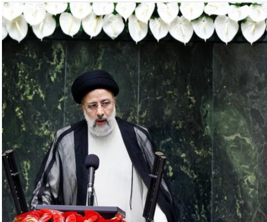
مراسم تحلیف آیت الله سیدابراهیم رئیسی

رئیس جمهور در مجلس شورای اسلامی با حضور نمایندگان مجلس و شورای نگهبان و رئیس قوه قضائیه در پیشگاه قرآن کریم سوگند یاد می کند که وظایف خود را مانند ترویج دین و اخلاق، پشتیبانی از حق، گسترش عدالت، پاسداری از قانون اساسی و ... به درستی انجام دهد.