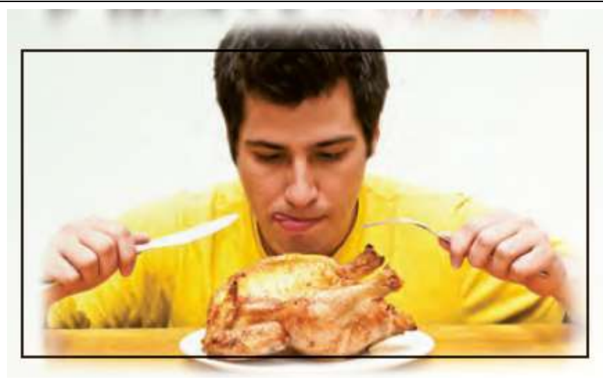
Eating Fast Food: خوردن غذای حاضری