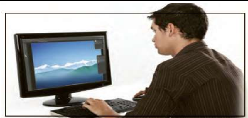
Overwork With Technology: