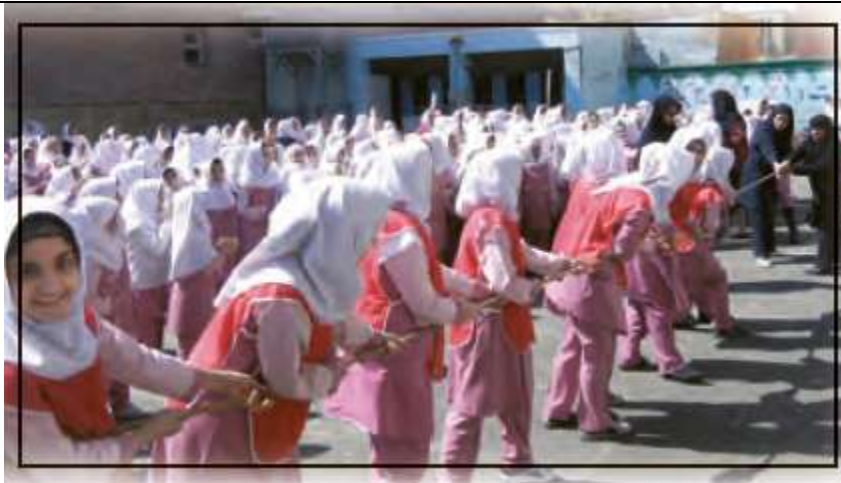
Daily Exercise: ورزش روزانه