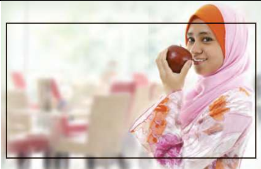
Healthy Diet: رژیم غذایی سالم