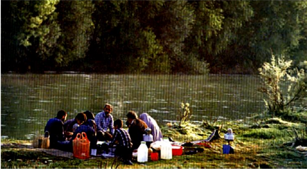
گیاهان موجب زیبایی محیط می‌شوند. مردم می‌توانند در محیط‌های زیبا و سرسبز استراحت و تفریح کنند و از زیبایی‌های طبیعت لذت ببرند.

گیاهان و جانوران نقش مهمی در زندگی انسان دارند. آیا می‌توانید با توجه به آنچه در درس علوم سال‌های قبل خواندید، فواید گیاهان و جانوران را بیان کنید؟ گیاهان و جانوران منابع غذایی برای انسان‌ها و سایر جانوران هستند بدون گیاهان و جانوران زندگی انسان‌ها به خطر می‌افتد. اکسیژن موجود در هوا را گیاهان تولید می‌کنند. بعضی از داروها از گیاهان به دست می‌آیند. از چوب درختان برای ساختن خانه‌ها و ابزار آلات و از الیاف گیاهان برای پوشاک استفاده می‌کنیم. از پوست جانوران برای تهیه وسایل مختلف و پوشاک استفاده می‌شود.