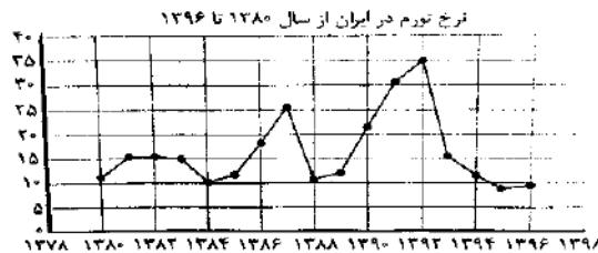
نمودار تورم در ایران، براساس سال پایه ۱۳۹۵