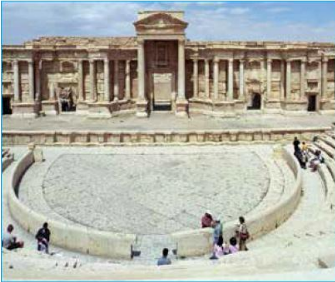
آثار باستانی تدمر (پالمیرا) پیش از تخریب توسط گروه داعش