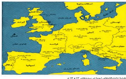
نقشه‌ی دانشگاه‌های اروپا در سده‌های ۱۳ و ۱۴ م

در این درس با تحولات بزرگی مانند تشکیل امپراطوری مقدس، گسترش فئودالیسم، جنگ های صلیبی همچنین با عوامل و نتایج این جنگ ها و جایگاه کلیسا در قرون وسطا آشنا شدیم.