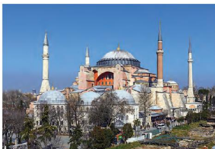
کلیسای ایاصوفیه، شاهکار معماری دوران بیزانس - استانبول

روم در قرن ۴ بر اثر مشکلات اداری و اقتصادی به دو بخش شرقی و غربی تقسیم گردید.